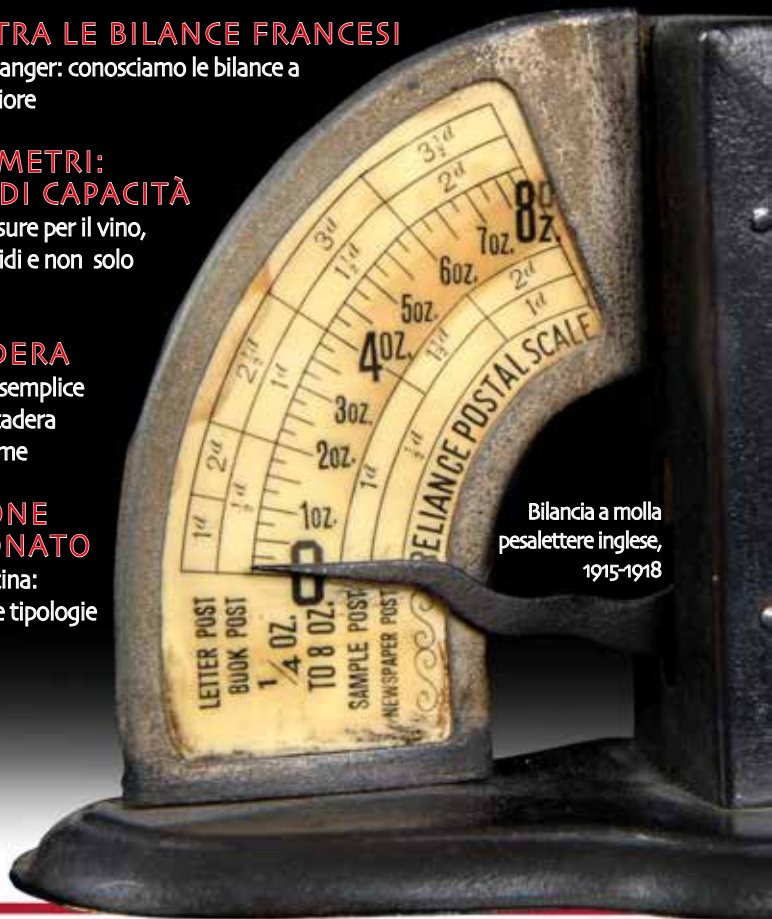
Bilancia a molla pesalettere inglese, 1915-1918